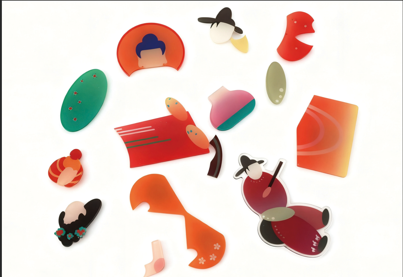
冰箱贴人物及碎片：

作为观者，你首先拾起的是散落的“角色碎片”。拼合它们，是为人物“绘影”——从局部到整体，观察其华服、其姿态、其法器。附于其上的“一人一言”，是角色的第一句台词，邀你进入他们世界的第一重门。