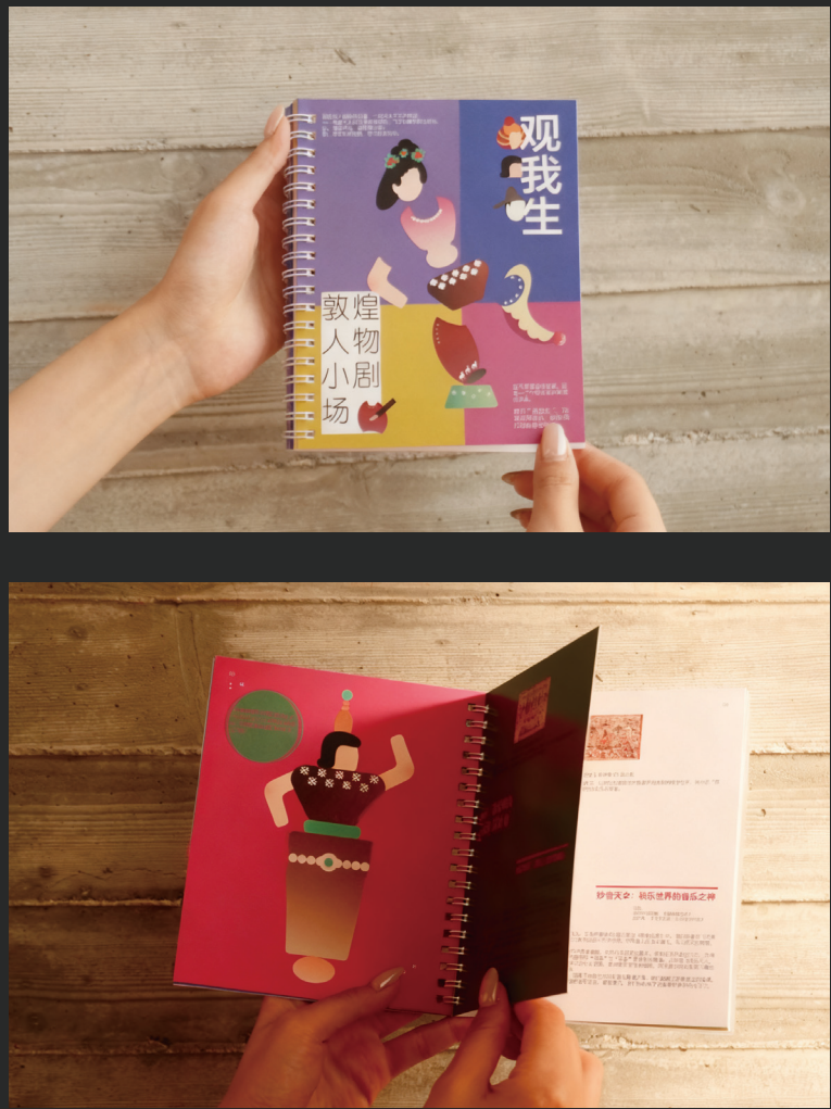
交互小册子及 DIY 烫画帆布包：