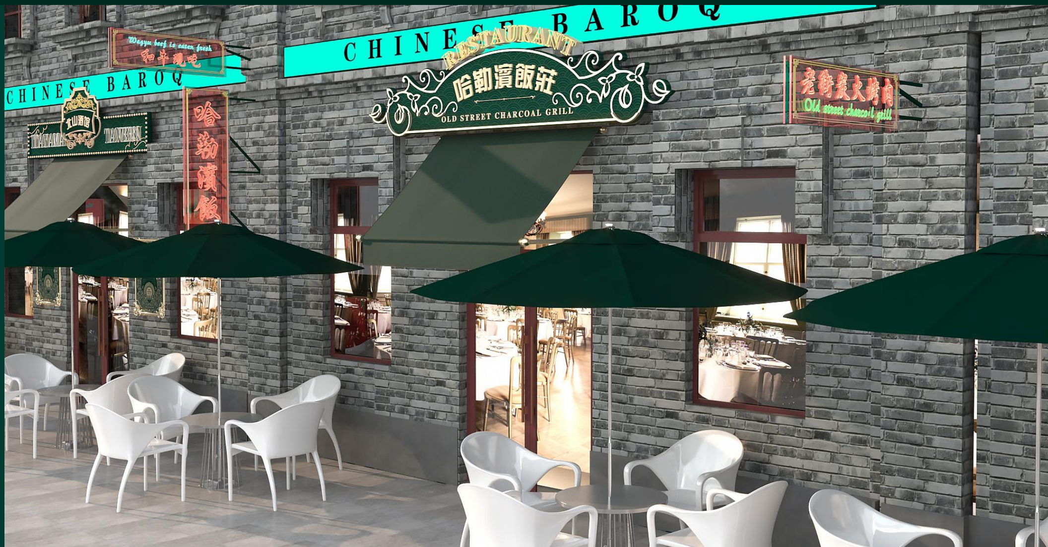
方向一 白天招牌效果02