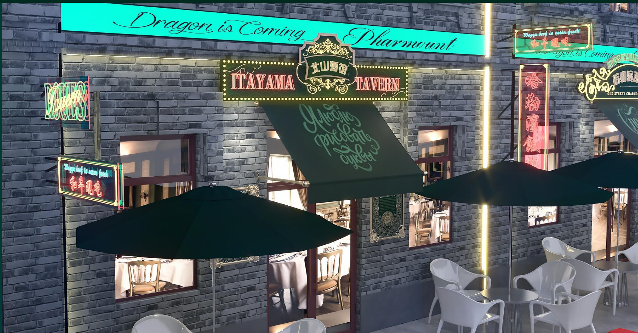
方向一 夜景招牌效果01