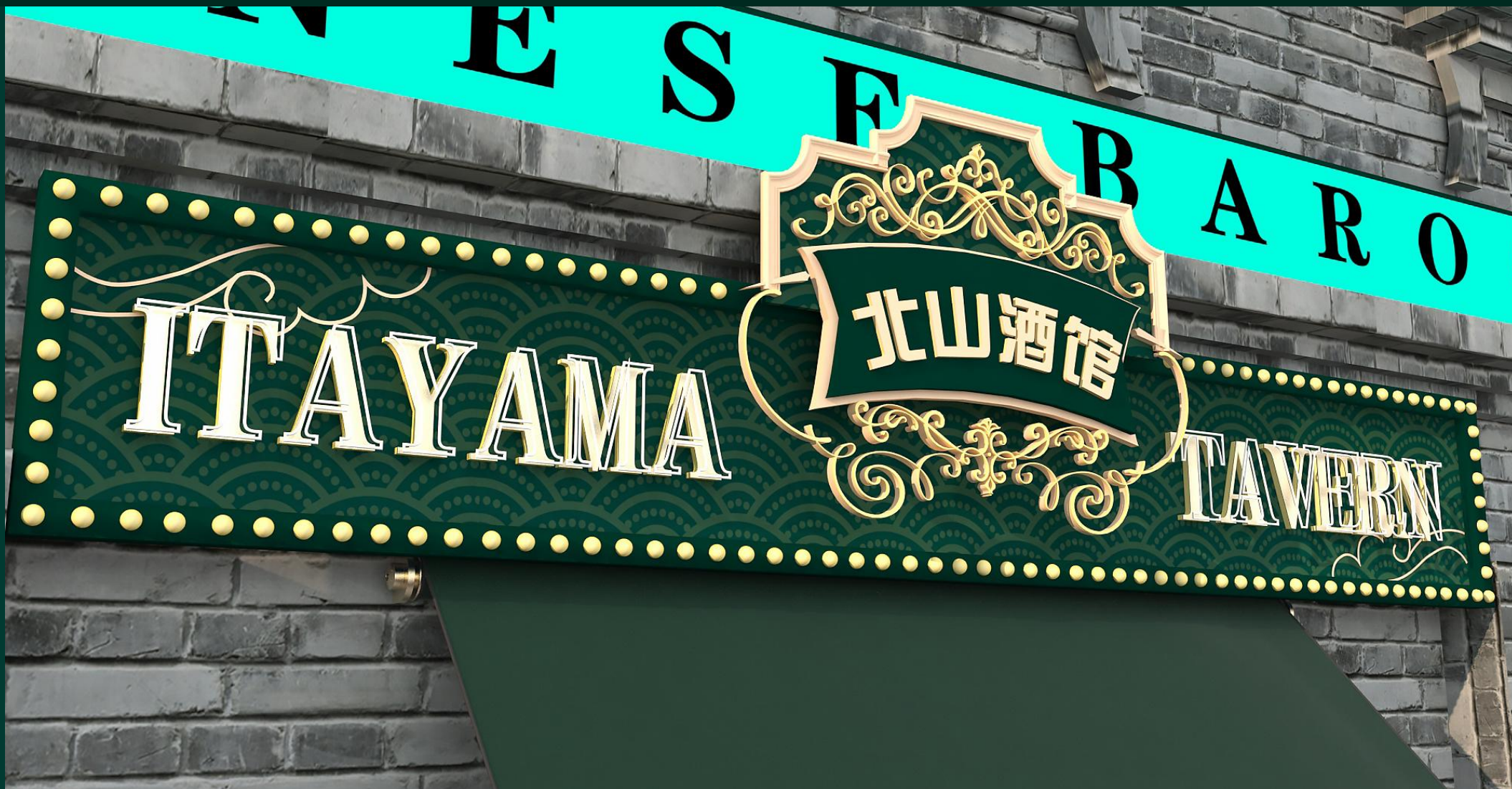
方向一 招牌细节效果01