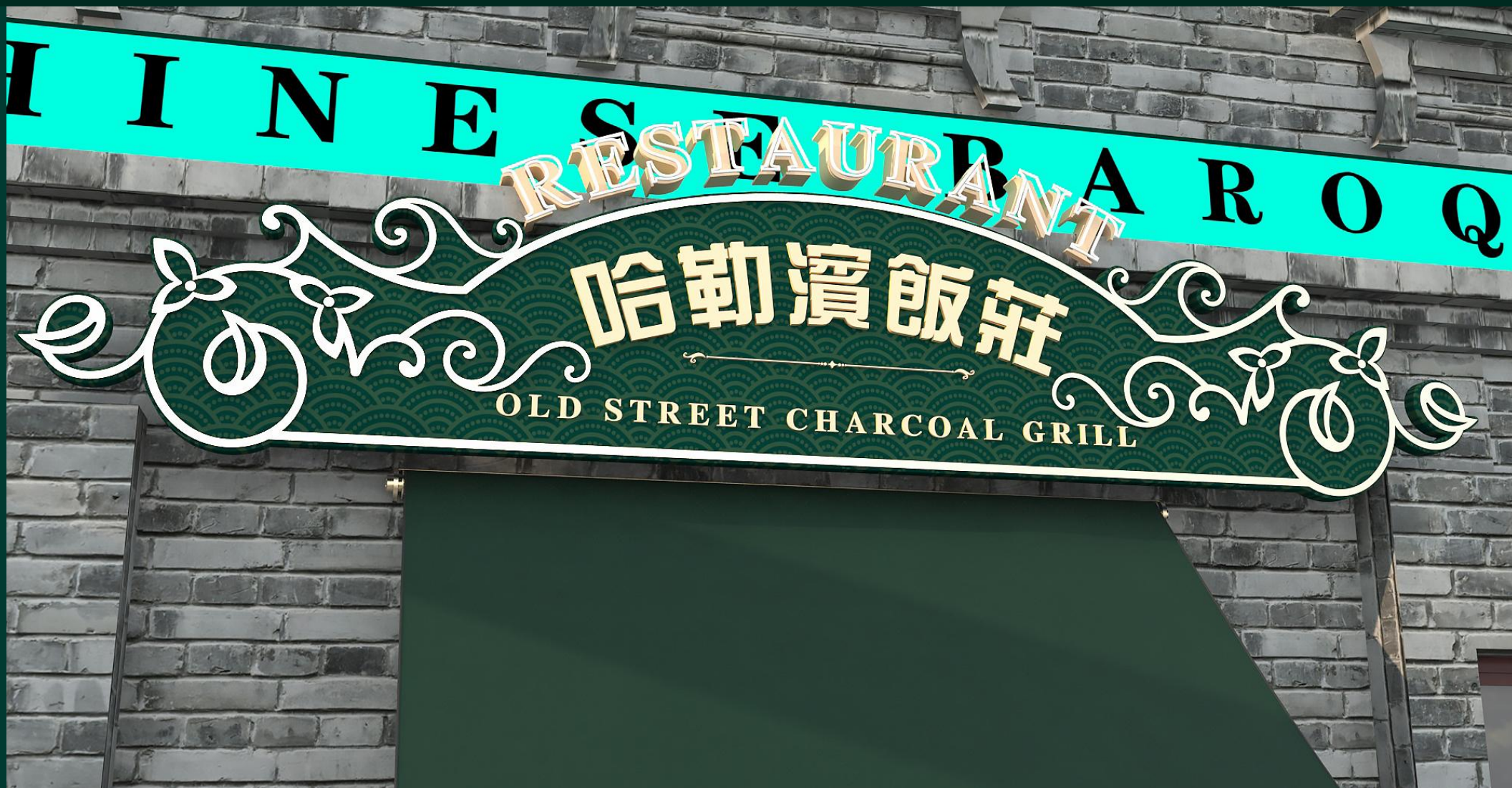
方向一 招牌细节效果02