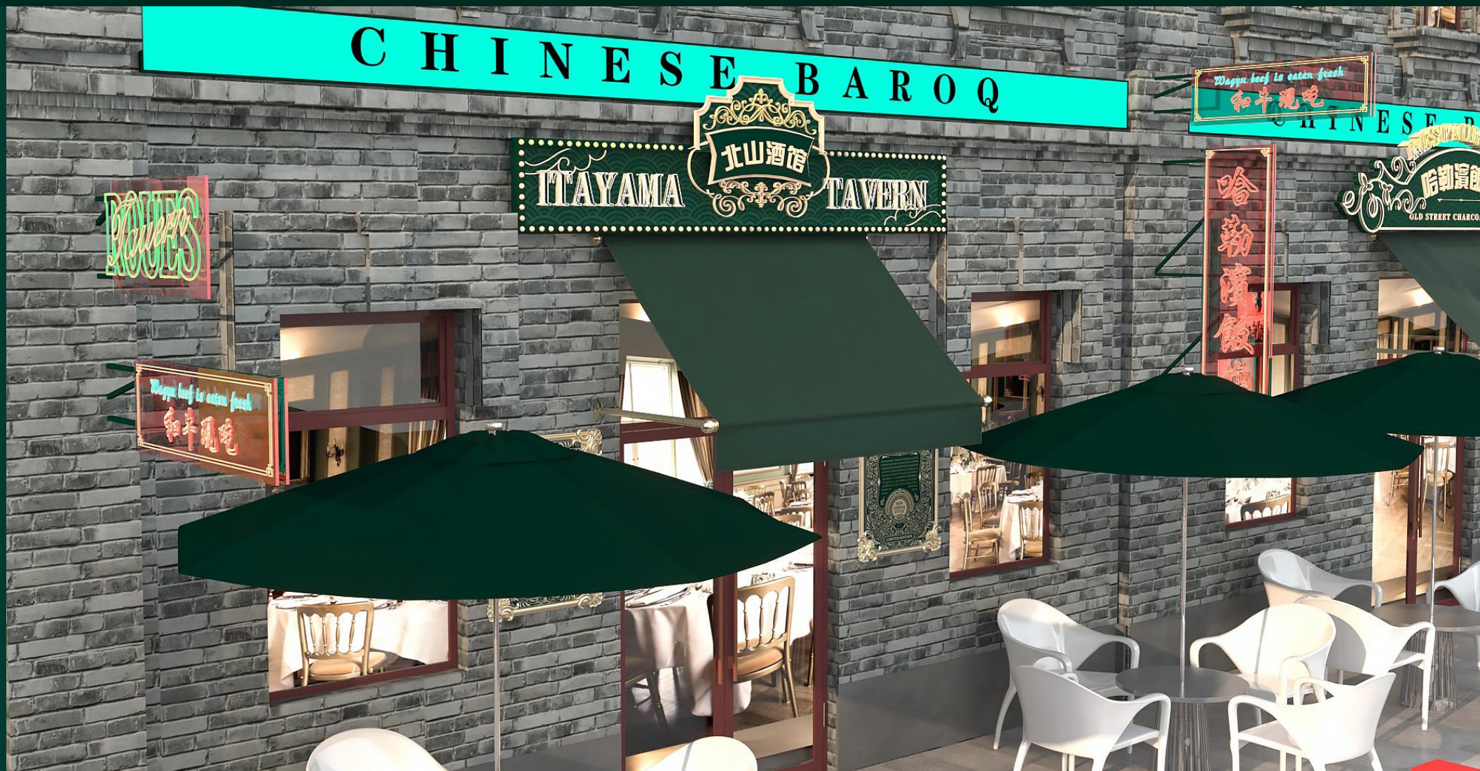
方向一 白天招牌效果01