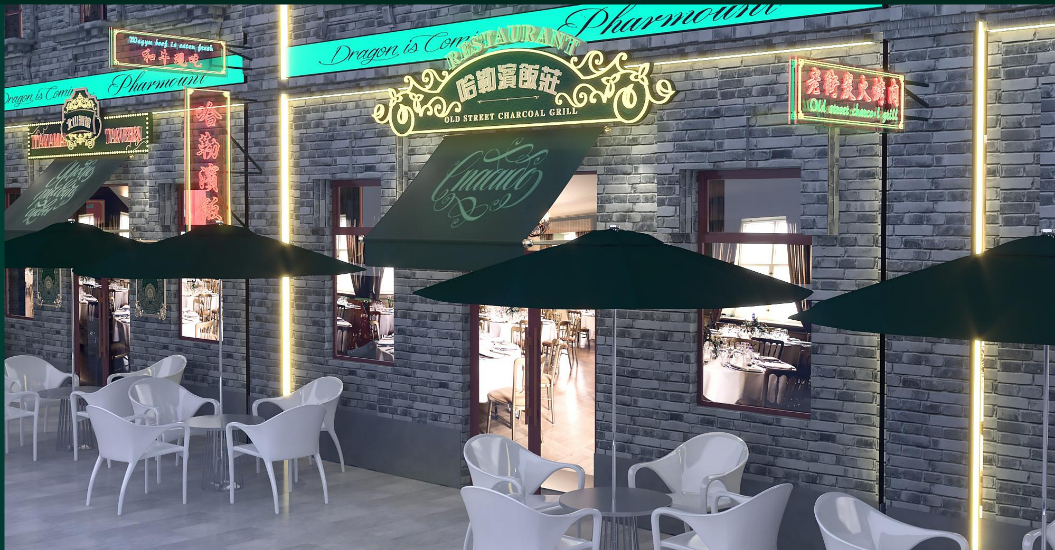
方向一 夜景招牌效果02